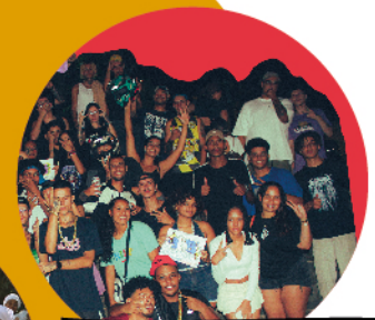
BDJ - Batalha da Jabu