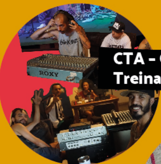
CTA - Centro de Treinamento Artístico