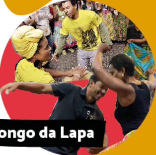
Jongo da Lapa