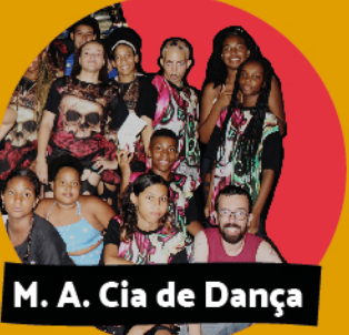
M. A. Cia de Dança