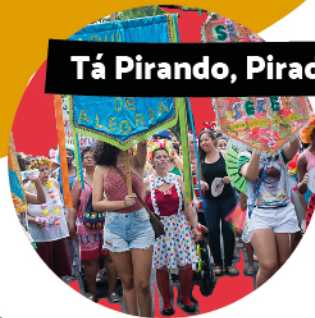
Tá Pirando, Pirado, Pirou!