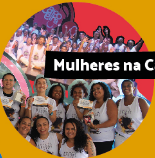
Mulheres na Capoeira