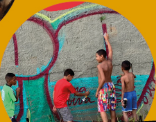
Rima Viva Hip Hop Crew