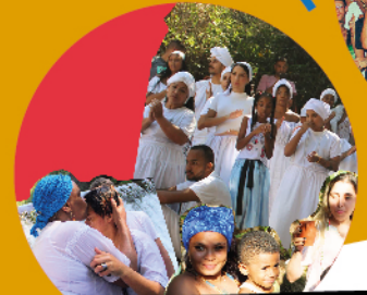
Ilê Vovó Maria Conga