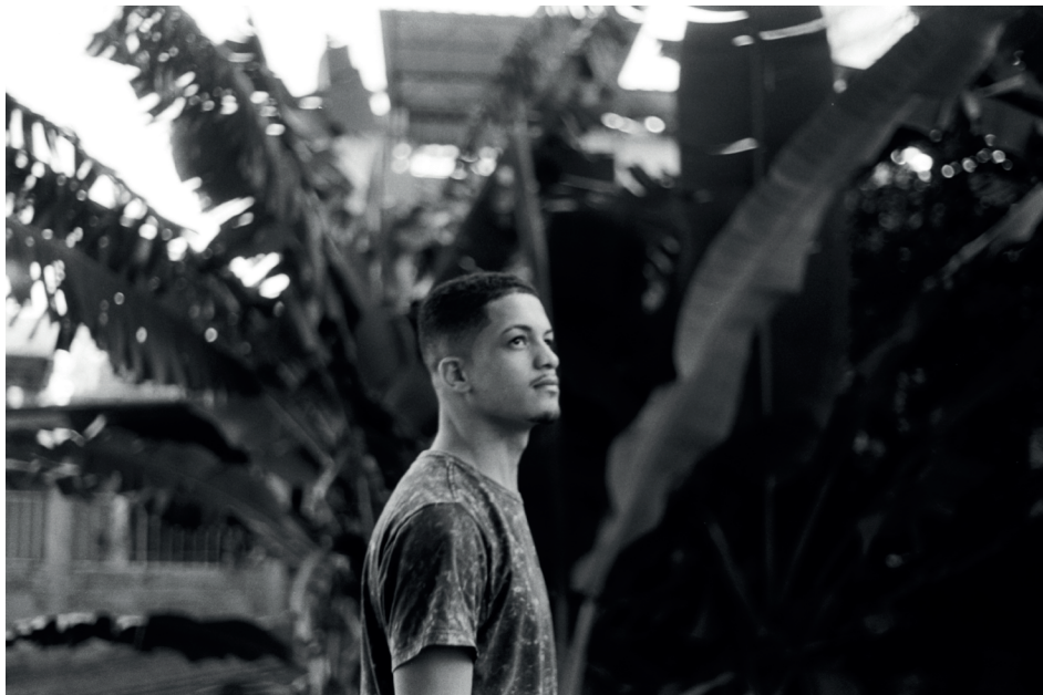
Weverton Luiz Ferreira